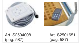
Art. S2504008 (pag. 587)